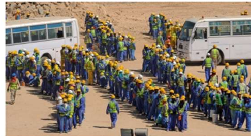
Sie haben einen langen Arbeitstag hinter sich: Ausländische Bauarbeiter in Doha warten auf den Bus, der sie in ihre Unterkunft zurückbringt.

12-Stunden-Arbeitstage, stickige Unterkünfte: Auf den Baustellen für die WM in Katar schufteten Billigarbeiter unter prekären Bedingungen. Nun nimmt das Seco die Fifa in die Pflicht.